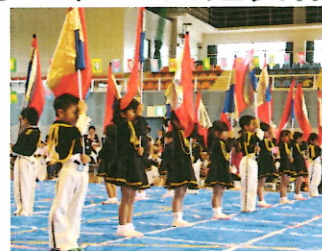
かっこよくキメた運動会！